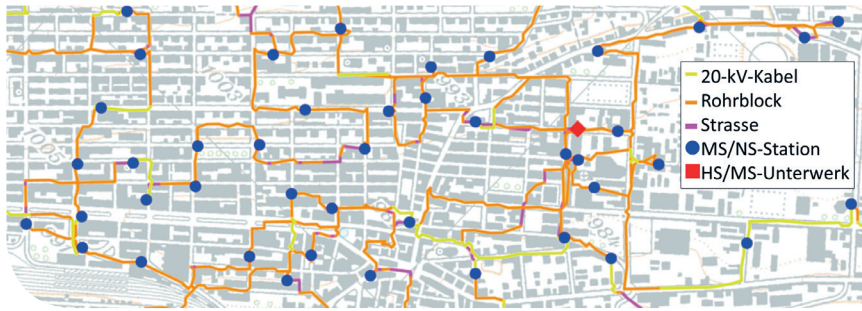
Ergebnisse der Zielnetzplanung