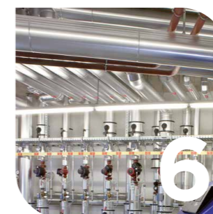
Technique du chauffage