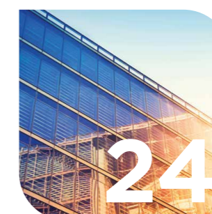
Facility & Property Management