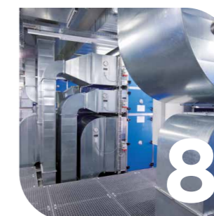
Technique de ventilation et de climatisation