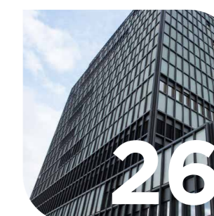
Multitec et Service Center pour les projets nationaux