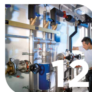
Technique des sanitaires