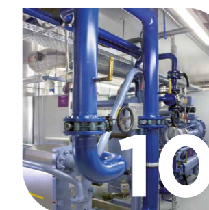
Technique du froid